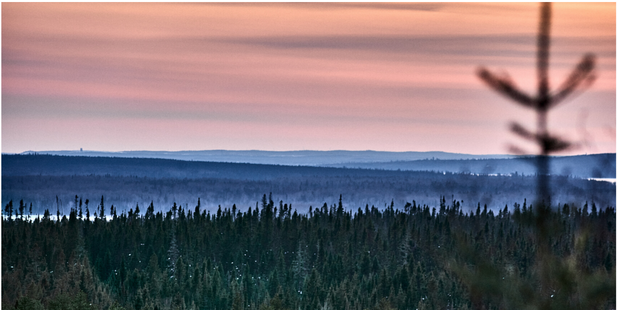
Photo: Coucher de soleil sur le versant Sud de l'esker Saint-Mathieu-Berry, sous l'emprise de claims

Pour leur part, les représentantEs des 55 communautés autochtones issues des 11 Nations autochtones n'ont eu droit qu'à une demie journée de consultation sur la plateforme Zoom le 14 avril 2023.