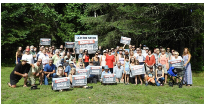
En haut: Collectif des Pas du Lieu; En bas: Rassemblement à Lac-des-Plages