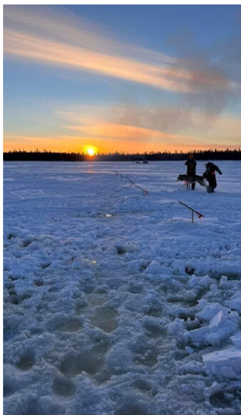
Photo: Lac Simard, territoire non-cédé de la Première Nation de Long Point ©Cassandra Pichette

Obliger les sociétés minières à contribuer à un fonds régional dont l'attribution des fonds sera administré par des membres des nations autochtones et de la société civile visées, suivant les priorités réelles du milieu, et non celles de l'entreprise